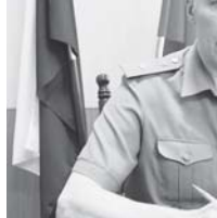
Июсти Влада Гареев

- В зоне нашей ответственности регулярно выявляются факты незаконного обогащения должностных лиц в погонах. Типичными и наиболее характерными способами и формами совершения коррупционных преступлений в войсках ВВО остаются мошенничество, присвоение и растрата денежных средств и военного имущества, злоупотребле-