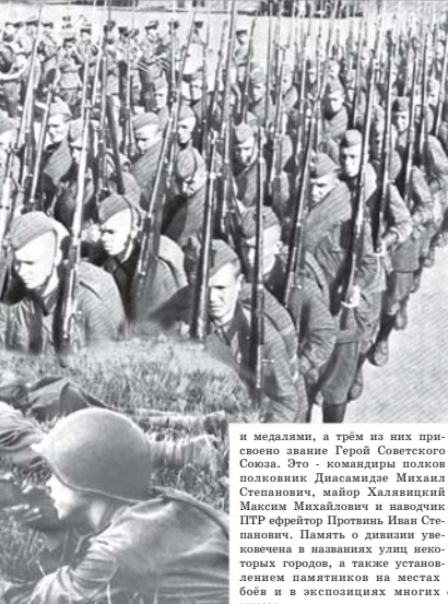
Прибавтки воина 87-й стрелковой дивизии участвовали в боях на побережье Балтийского моря и вместе с другими соединениями армии заперли выход противнику на Курляндия в Восточную Пруссию.

Важнейшим этапом боевого пути 87-й стрелковой дивизии было ее участие в боях по освобождению Крыма. С 24 октября, после кратковременного отхода, соединение опять вступает в бой с противником. В ходе наступления по территории Херсонской области освобождает заводчик Аскания-Нова, посёлок Чаплино, Григоровка и другие, а 2 ноября выходит к Перекопскому валу и штурмует его. В последующем до 8 апреля 1944 года держит оборону за Перекопским валом. В апреле в составе 2-й гвардейской армии 4-го Украинского фронта дивизия приняла участие в освобождении Крыма. Прорвав оборону противника на Шипуных позициях, она прошла с боями от Перекопа до Севастополя, одной из первых она ворвалась в бухту Южную, заняла вокзал и вышла к знаменитой Севастопольской панораме. За бой на Перекопе дивизия получила наименование Перекопской, а за штурм Севастополя была награждена орденом Красного Знамени. После освобождения Крыма 87-ю стрелковую дивизию вернули в 1-ю армию. В июне армия перебросили в Белоруссию, где в июле-сентябре в составе 1-го Прибалтийского фронта она приняла участие в Белорусской операции, а в сентябре - ноябре - в Прибалтийской операции. В боях на территории