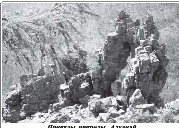
Причуды природы. Алханай.