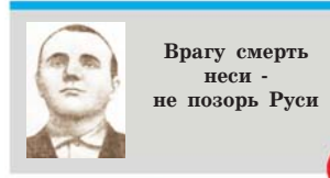
Врагу смерть неси - не позорь Руси