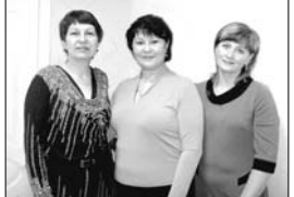
Пресс-служба Восточного военного округа