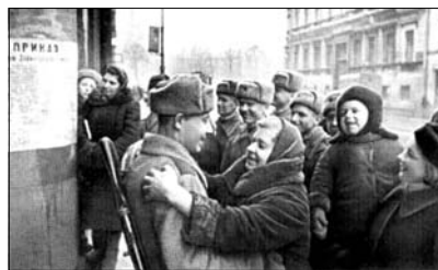
Подготовил Владимир КРАСНОУКТСКИЙ.