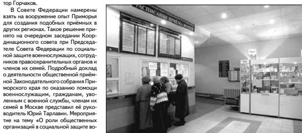
На зубу дня