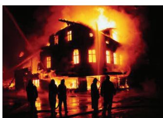
Поджигатель домов на Пятой площадке в Хабаровске найден и водворен в СИЗО.

Полицейские уже доказали 10 поджогов. Возможно, он причастен и к другим пожарам в районе. Ведется следствие.