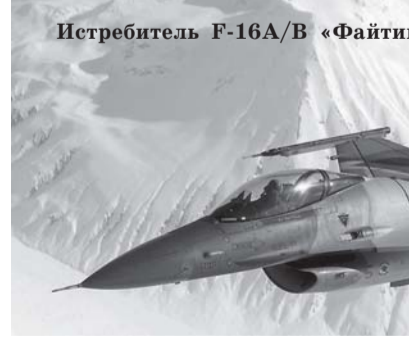
Истребитель F-16A/B «Файтинг Фалкон».

Согласно публикации японского информационного агентства Киодо