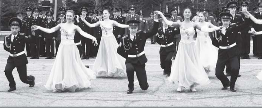
5. Танец в честь выпускников.

По словам родителей ребят, суворовское училище действительно дало их сыновьям очень многое. Они не только возмужали, окрепли физически, получили серьёзный багаж знаний, их воспитали патриотами Родины. Спасибо за это командирам и преподавателям!