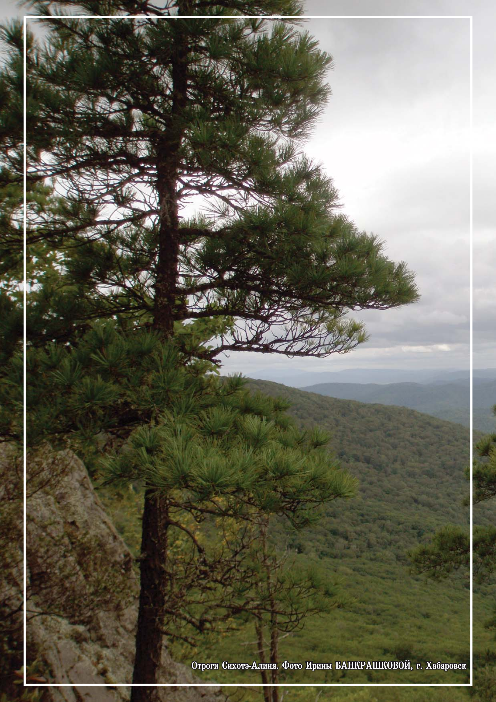
Отроги Сихотэ-Алиня.