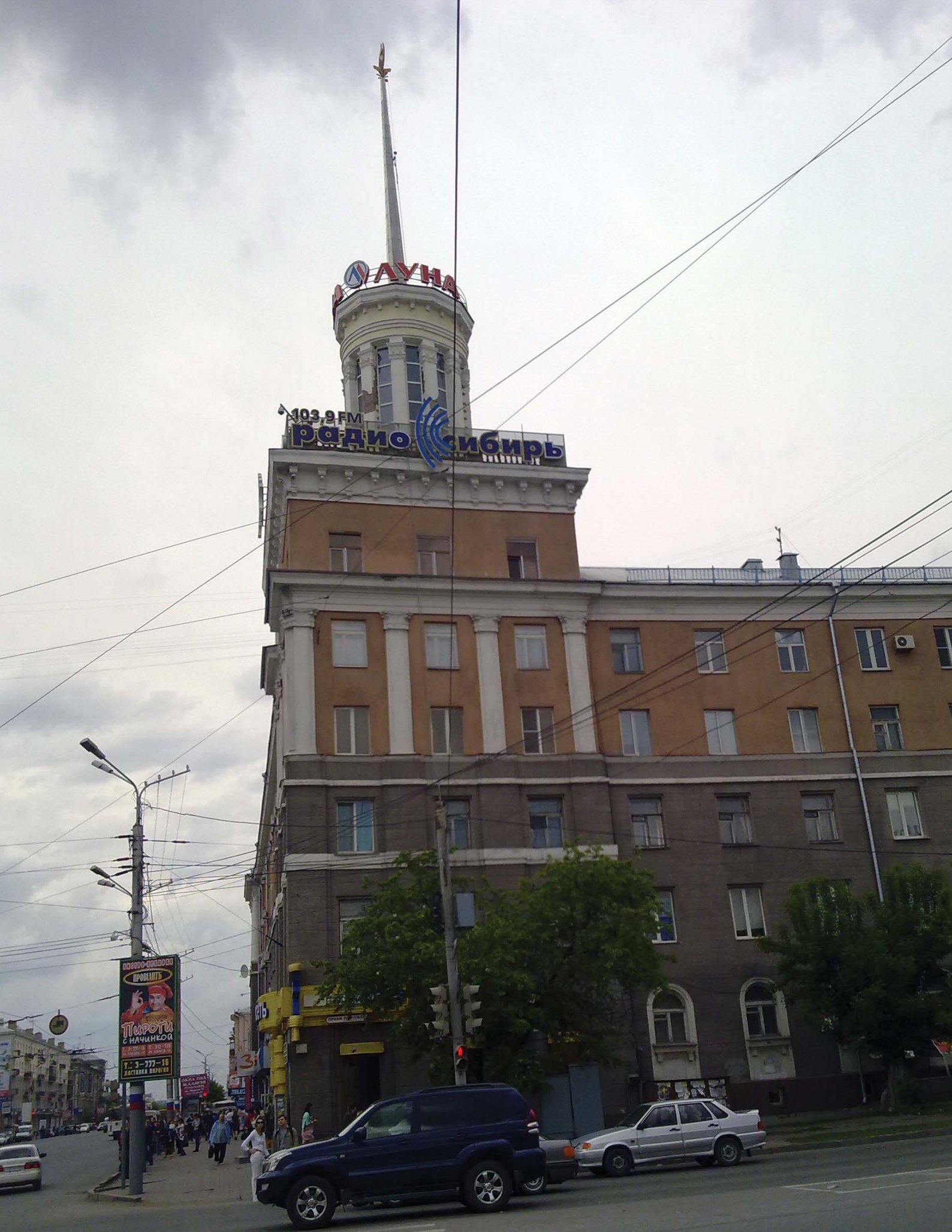
Фото Игоря ФЕДОРОВСКОГО, г. Омск