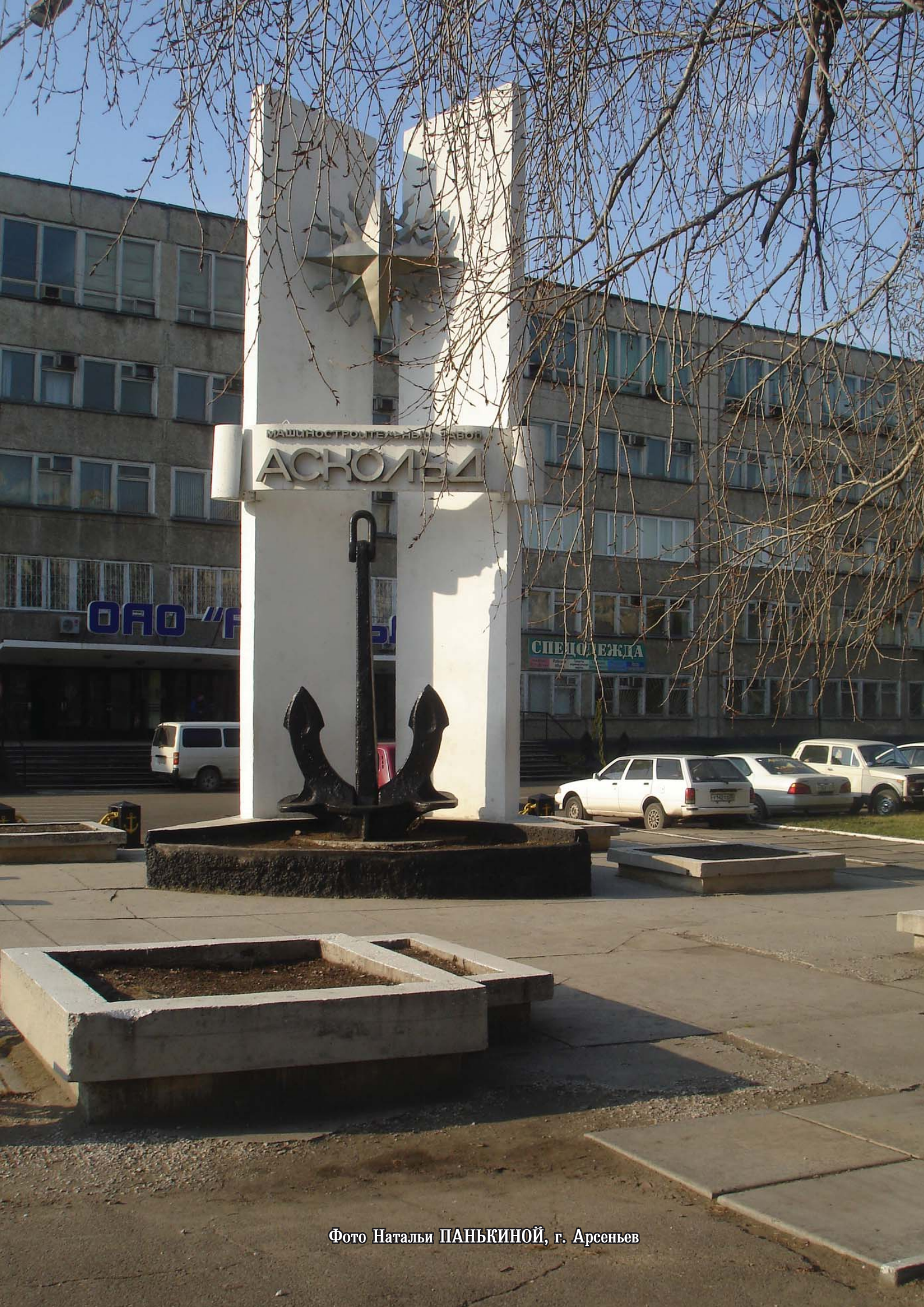
Фото Натальи ПАНЬКИНОЙ, г. Арсеньев