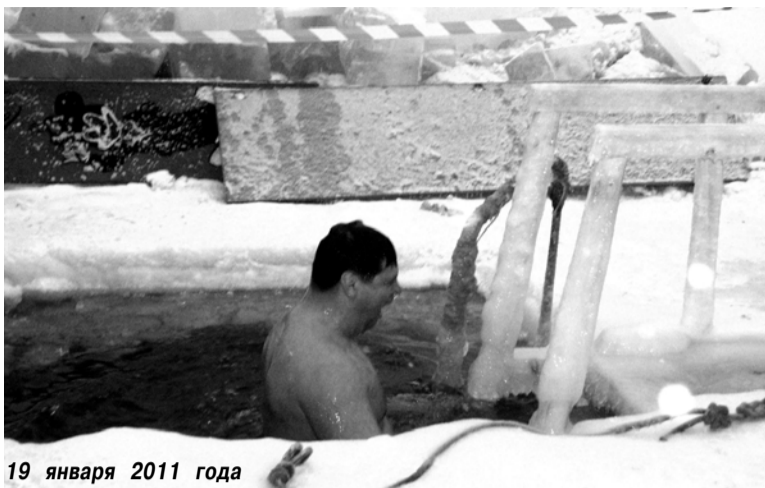
19 января 2011 года

Чин водосвятия прошёл на реке утром 19 января. Священник освятил место для купания и набора святой воды. Считается, что после этого вода становится святой и её можно хранить в течение всего года. Святая вода лечивает от многих болезней, ей